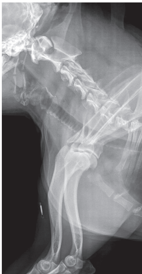
Slika 3. Slučajan rendgenski nalaz migracije mikročipa u psa (bostonski terijer, star 6 godina) u područje srednje trećine nadlaticice. Na istom rendgenskom prikazu nalazi se područje vrata gdje nalaz mikročipa izostaje.

vezati i s njegovom migracijom. Prestanak rada mikročipa je moguća, ali vrlo rijetko zabilježena pojava. Njegova migracija je također rijetka, ali definitivno najzastupljenija komplikacija (BSAVA, 2002.), s regijom lakta i ramena kao najčešćim mjestima njegova pronalaska kod malih životinja (Swift, 2000., BSAVA, 2002.). Mikročipovi implantirani u rameno područje imaju veću vjerojatnost migracije od onih implantiranih u druga, preporučena područja (Jansen i sur., 1999.).