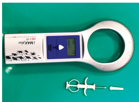
Slika 1. Čitač mikročipova i iskorišteni jednokratni aplikator u čijoj se igli prije aplikacije nalazi mikročip s jedinstvenim petnaesteroznamenkastim kodom.

Prilikom mikročipiranja podaci se unose u Središnji upisnik pasa tzv. Lysacan sustav, dostupan na internetskoj stranici koju službeno vodi Ministarstvo poljoprivrede (Uprava za veterinarstvo i sigurnost hrane). Lysacan sustav sadržava podatke o vlasniku, nacional životinje, identifikacijski broj mikročipa, datum aplikacije i druge informacije. Uz mikročipiranje, propisano je obvezno cijepjenje pasa protiv bjesnoće te se i podaci o cijepjenju upisuju u sustav. Umrežavanjem podataka na nacionalnoj razini postignuta je jednostavna identifikacija bilo kojeg mikročipiranog psa uz pomoć čitača i pristupa Lysacan sustavu. Mikročip u sebi sadrži kôd od 15 brojevanih znamenki koji se sastoji od kôda države podrijetla životinje, kôd proizvođača te jedinstvenog broja psa. Od 13. lipnja 2011. godine propisana je