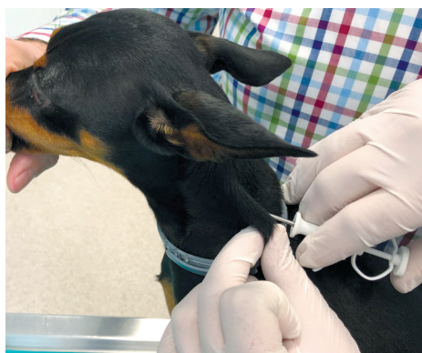
Slika 2. Prikaz aplikacije mikročipa u potkožje lijeve strane vrata psa.